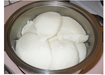
NSHIMA, HOOFDVOEDSEL IN MALAWI

Kinderen die in de groei zijn of zwangere vrouwen hebben veel extra ijzer nodig. Dat zit in